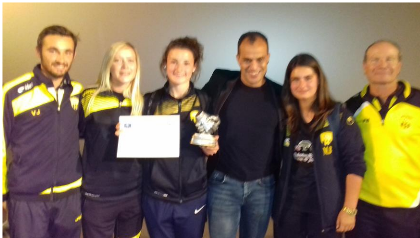
Equipe Féminine de Saujon