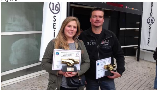
Equipe U15 de La Rochelle