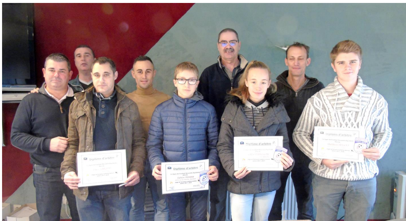
Photo : Les heureux élus entourés des membres du bureau de la Commission départementale d'arbitrage.

Félicitations aux quatre nouveaux candidats qui vont œuvrer sur les terrains de notre département.